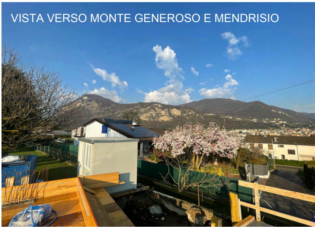
VISTA VERSO MONTE GENEROSO E MENDRISIO