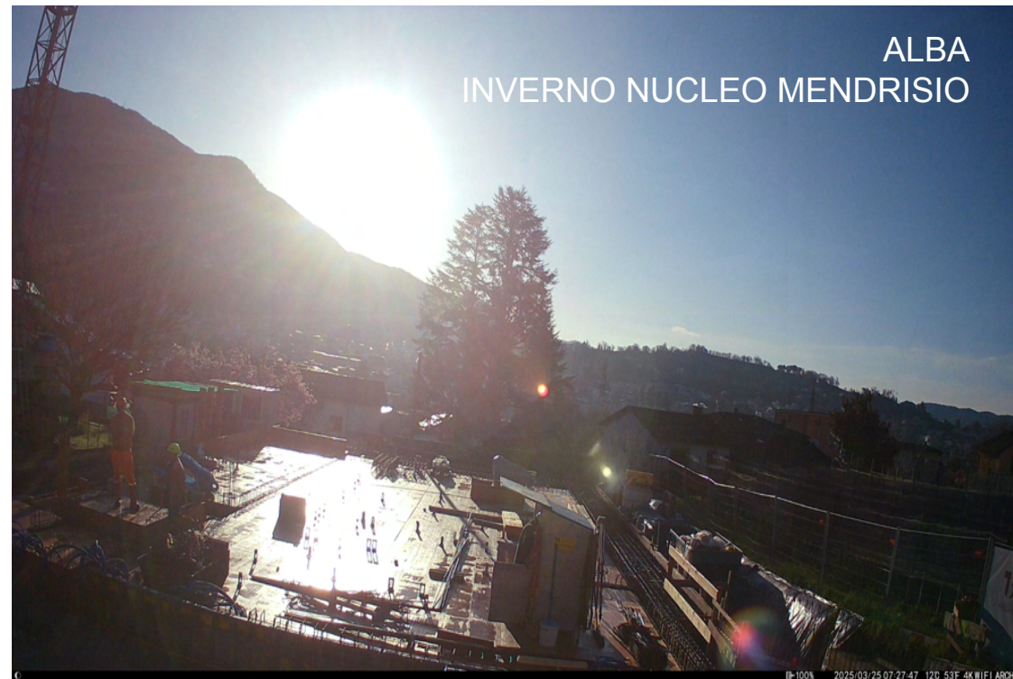
ALBA INVERNO NUCLEO MENDRISIO