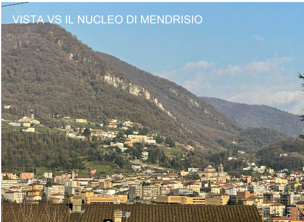
VISTA VS IL NUCLEO DI MENDRISIO